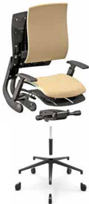
Meccanismo synchron Synchron mechanism

Versione per tappezzeria Version for upholstery