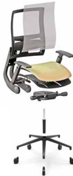
Meccanismo synchron Synchron mechanism

Versione schienale rete Mesh backrest version