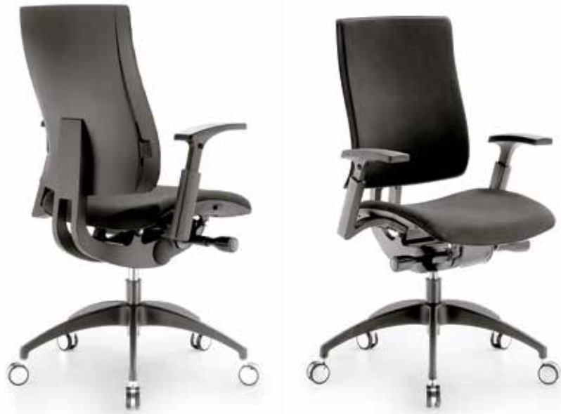
SKILL FOR UPHOLSTERY AND SYNCHRON MECHANISM