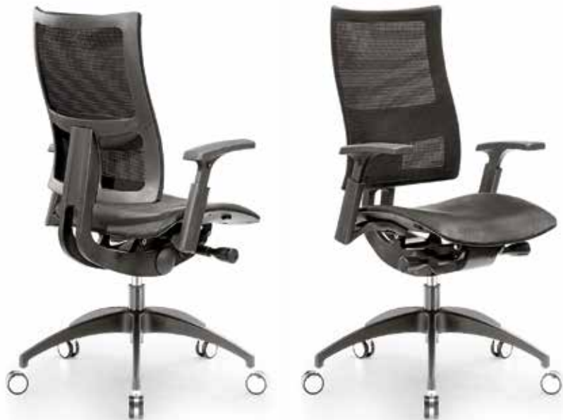
SKILL WITH MESH BACKREST AND SYNCHRON MECHANISM